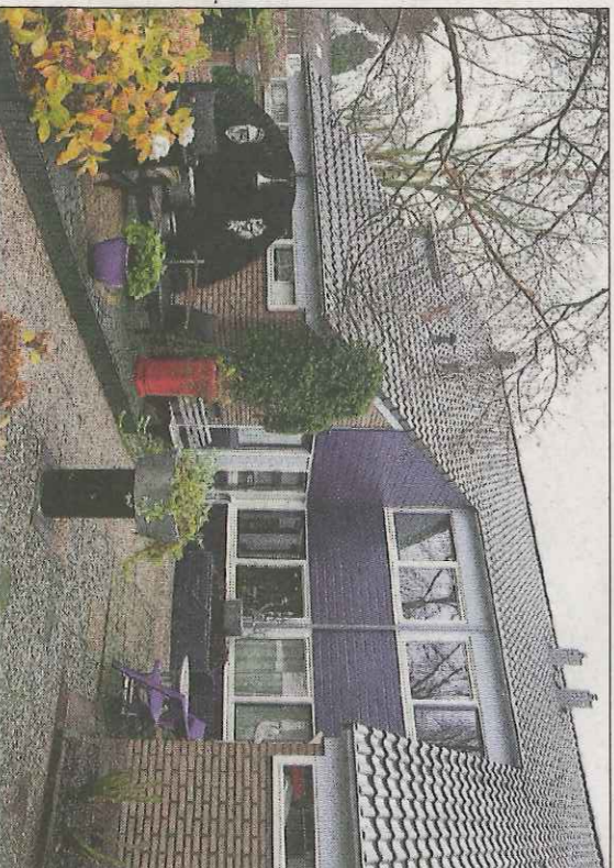
De woning heeft een riante voor- en achtertuin.

De bewoners van tien woningen aan de Poorterstraat staan nog een renovatie te wachten. In samenwerking met een dakramenfabrikant worden deze huizen voorzien van grote raampartijen. Dit is een pilotproject waarbij de ‘actieve house-principes worden gehanteerd. Daarbij wordt een huis zo verbouwd dat het energie-neutraal is of zelfs energie oplevert.